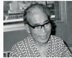
金工 河合 寿成 (1902 — 1982)

鳥取県鳥取市に生まれる。1930年第11回帝展に染色作品「向日葵を主題とする衝立」初出品初入選する。晩年の4年間を関市で過ごす。