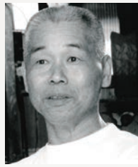
陶芸 西功一 (1948 — )

関市生まれ。市内に工房を構える。地元の山野から採取した草木で染めた色鮮やかな絹糸で、紋紗、生絹を織る。2010年、「紋紗」で人間国宝に認定される。