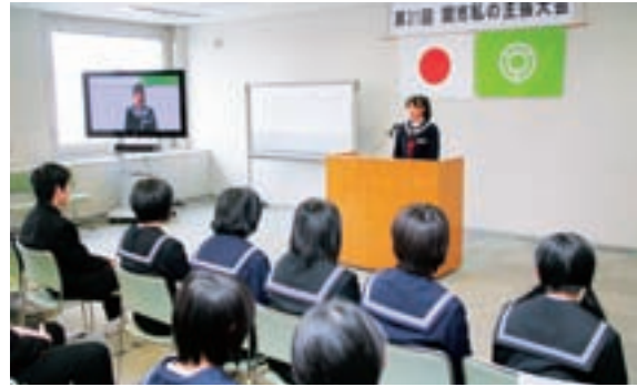
▲大会の様子は各中学校へ中継されました