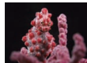
ピグミーシーホース

自然を撮影した様々な写真を通して、自然の中の不思議や自然と人間との関わり、自然の大切さを考える写真展です。