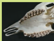
カモシカの上アゴ

関市小屋名 1989 (百年公園内) ☎0575(28)3111 休 / 月曜日(祝日の場合は翌平日) 開館時間 / 9:30 ~ 16:30