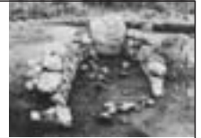
中屋敷古墳 横穴式石室 (岐阜市)

11 月 15 日(火)～平成 24 年 1 月 15 日(日) 一般 320 円、大学生 110 円、高校生以下無料