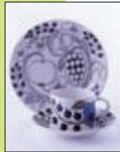
アラビア 《パラディッシ》

11 月 12 日(土)～平成 24 年 2 月 12 日(日) 一般 320 円、大学生 210 円、高校生以下無料