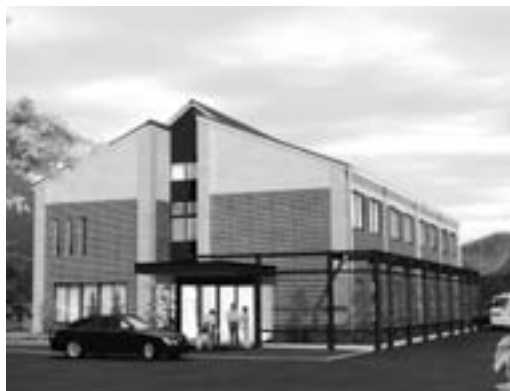
武儀・上之保統合診療所完成予想図