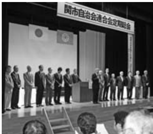
▲新しい役員の方皆さん

第60回関市自治会連合会定期総会が5月17日、わかくさプラザ「学習情報館・多目的ホール」で開催されました。総会に先立ち、長年、自治会活動にご尽力された自治会長19人と自治会役員91人に、市長と連合会長から感謝状が贈られました。総会では、平成23年度の事業目標や新役員を決めました。