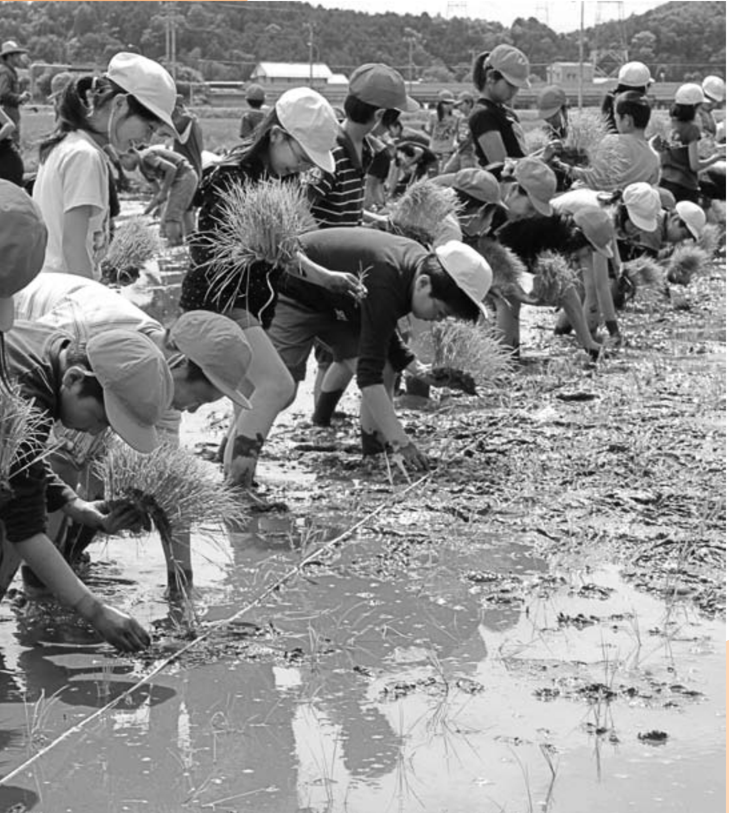
田植え体験(下有知小学校)