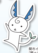
関市イメージキャラクター 「関*はもみん」