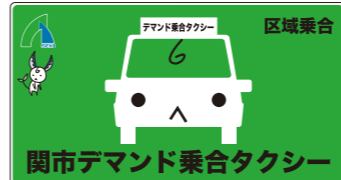
▲タクシー掲示ステッカー