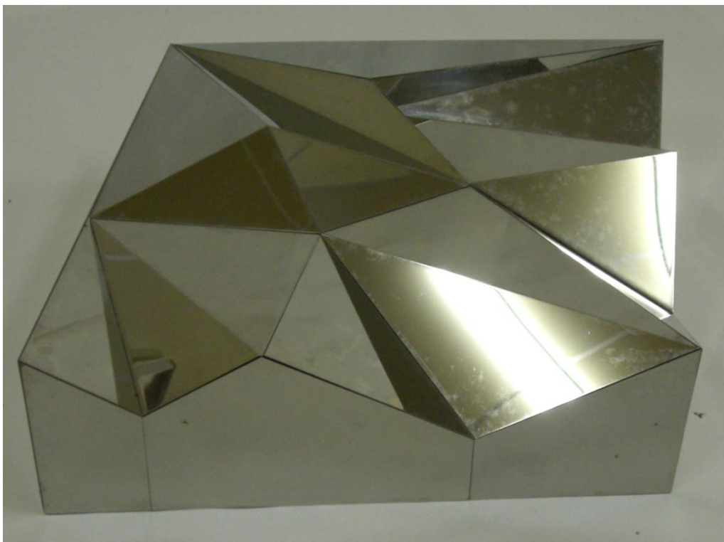
《作品 84-B (NO.2)》