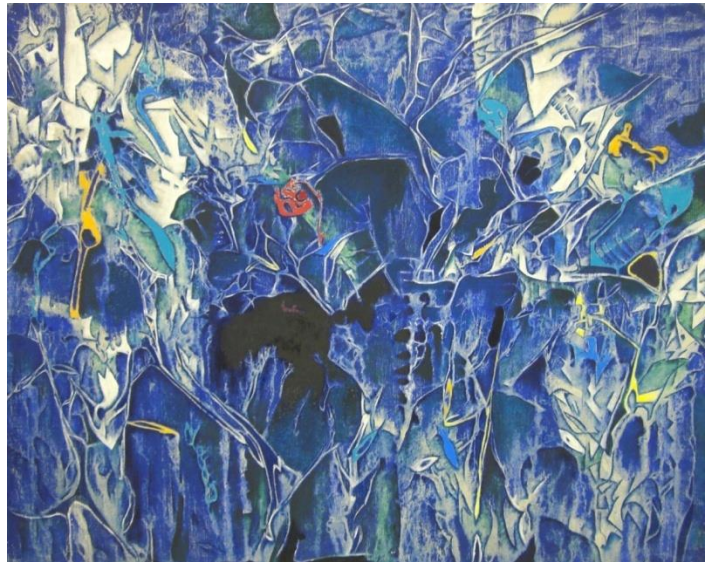
《作品 B' 65》