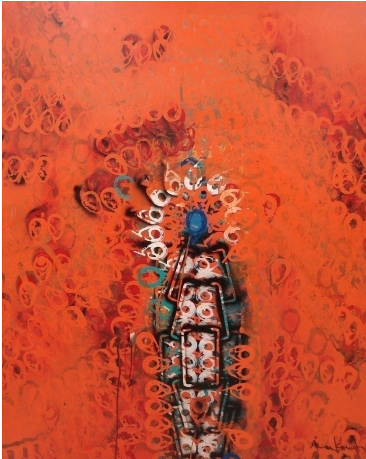
《主役はブルー、グリーン、赤の》