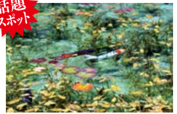
「名もなき池」(通称:モネの池) 「フラワーパーク板取」付近 板取事務所 TEL0581-57-2111