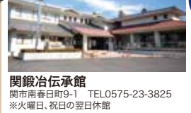
関鍛冶伝承館 関市南春日町9-1 TEL0575-23-3825 ※火曜日、祝日の翌日休館