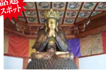
「冠冠大日如来」(通称:五郎丸ポーズの仏像) 関善光寺(宗休寺) 関市西日吉町35 TEL0575-22-2159