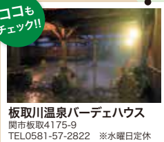
板取川温泉バーデハウス 関市板取4175-9 TEL0581-57-2822 ※水曜日定休