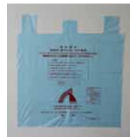
【燃やせないごみ袋】