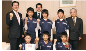
安桜小タグラグビーチームが全国大会に出場

小学校でのタグラグビーも盛んで、最近では関市の小学校チームが県大会・東海大会を経て、全国大会でも好成績を収めています。