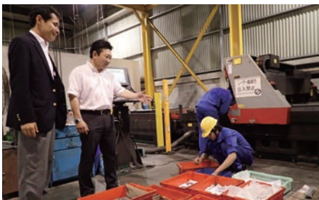
(株)キョウワさんの現地工場を見せていただきました(ベトナム・ホーチミン)

ベトナムでは、首都ハノイにて知事に同行した現地大手訪日旅行会社での観光PRの他、ダナンにて中部学院大学と提携しているダナン医薬技術大学への訪問、ホーチミンにて関市から進出している製造企業の現地法人の工場視察などを行いました。