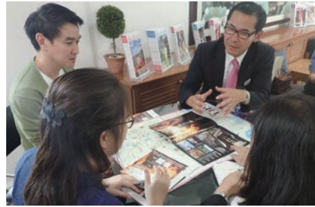
旅行雑誌社で観光PR(タイ・バンコク)

タイでは、首都バンコクにて県と一緒に現地大手訪日旅行会社を訪問したほか、関市独自に現地の旅行雑誌社を2社訪問して関市の観光PRを行いました。