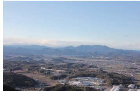
素晴らしい眺めも楽しみのひとつ

加えて、今年は板取地域と田原地域で「トレイルランニング」を始めよう、という動きが住民の皆さんの中から生まれています。