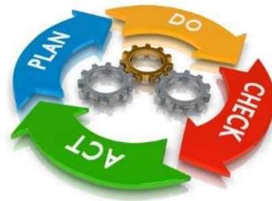
●第5次総合計画の柱の範囲