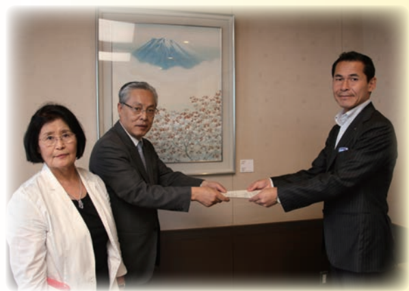
照会先 企画政策課 (☎ 23 - 7014)

市内にある高校、大学、専門学校に通う学生が、まちづくりに参加し、関市への愛着を持つことで、市内に就職し定住することが期待されます。若者の発想を生かし、若者が活躍するまちづくりを推進することが必要です。