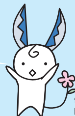
健康応援隊 関*はもみん

まずは、受診券を持って最初の一步を踏み出してみませんか? その一步があなたの健康な未来へつながるはず!