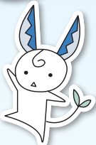
関市イメージキャラクター 「関＊はもみん」