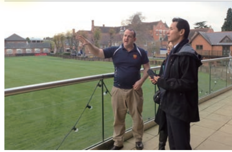
日本代表が使用したグラウンドを視察

でしたが、普段から生徒さんが利用しているということもあって、現在の芝の状態は驚くほどの高いレベルではありませんでした。また、学校の体育館を利用してトレーニング機器を設置したり、既存のシャワールームや医務室を使ったりと、学