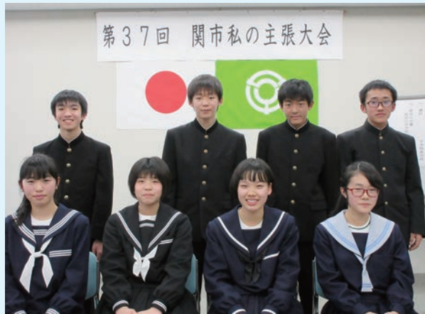
第37回関市私の主張大会 生徒運営委員の皆さん