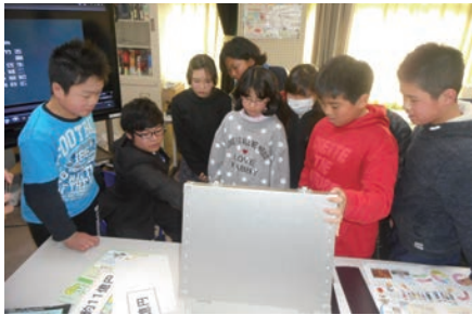
一億円の重さをレプリカで体感しました。