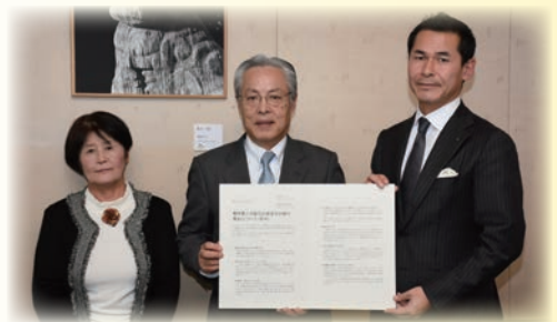
照会先 企画政策課 (☎ 23-7014)

高校生、大学生などがまちづくりで活躍できる機会を創ることが大切です。若者がまちづくりに関わることは、本市への定住や担い手の育成につながります。