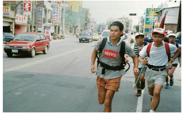
台中から台北へ縦断中(台湾) 大学2年時

う考えはまったくなく、当時から関心があったアジアを自分で見てみたい、という熱情のようなものしかなかったと思います。