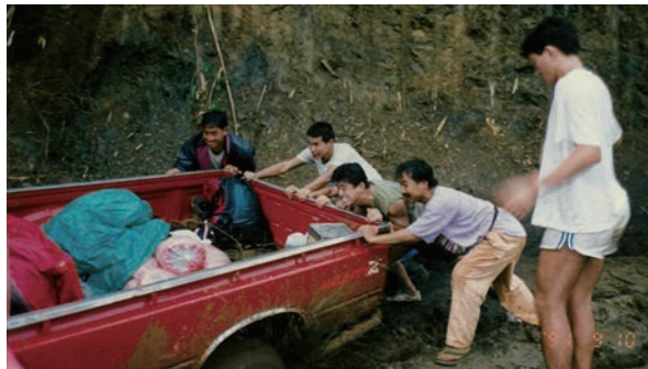
山岳民族の村へ向かう途中で(タイ) 大学1年時(左から2人目)