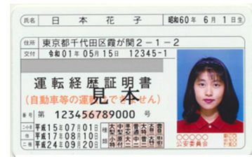
運転経歴証明書（見本）