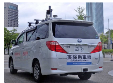
自動運転車両（群馬大学）