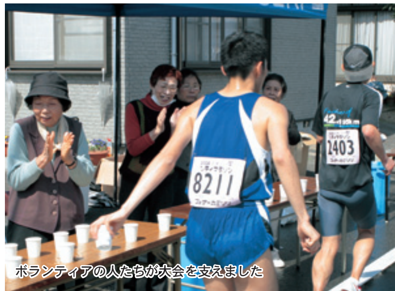
ボランティアの人たちが大会を支えました