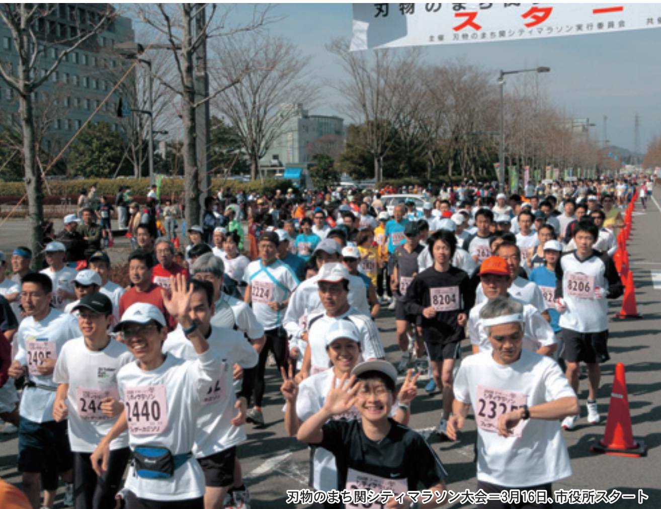
羽物のまち関シティマラソン大会=3月16日、市役所スタート