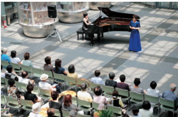
▲毎回多くの市民でいっぱいになるコンサート

バイキングでお腹を満たした後は、1階のホールに下りてアフタヌーンコンサートへ。バイキングと同日開催され、毎回アマチュアの方のミニコンサートを無料で楽しむことができます。次回開催日は広報でチェック!