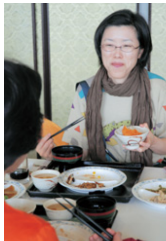
▲とてもおいしそうに食べるお姉さん。この日はお母さんと一緒にみえたのだそう。

市役所の食堂で毎月1回行われるバイキングをご存じですか?なんと600円というお値段で、ご飯物からデザートまで堪能できてしまうというお得さ!家庭的な味付けも好評で、11時半の開店前から列が出る程の盛況ぶり。