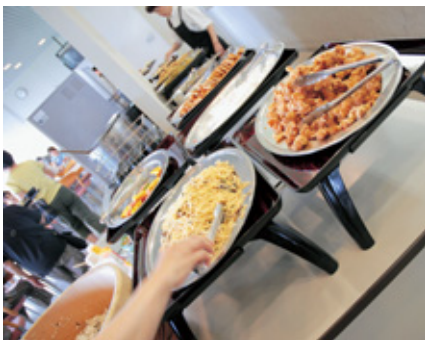
▲どれもおいしそうな料理がたくさん