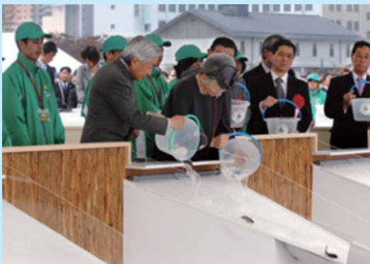
▲大会では両陛下による放流が行われます

天皇皇后両陛下を関市へお迎えします。市民の皆さんの英知と協力により、この大会を成功させましょう。そして豊かな森林、河川、海を次の世代へ残していきましょう。