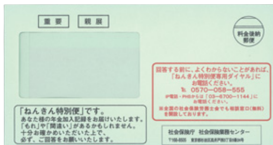
4月から10月の緑色の封筒