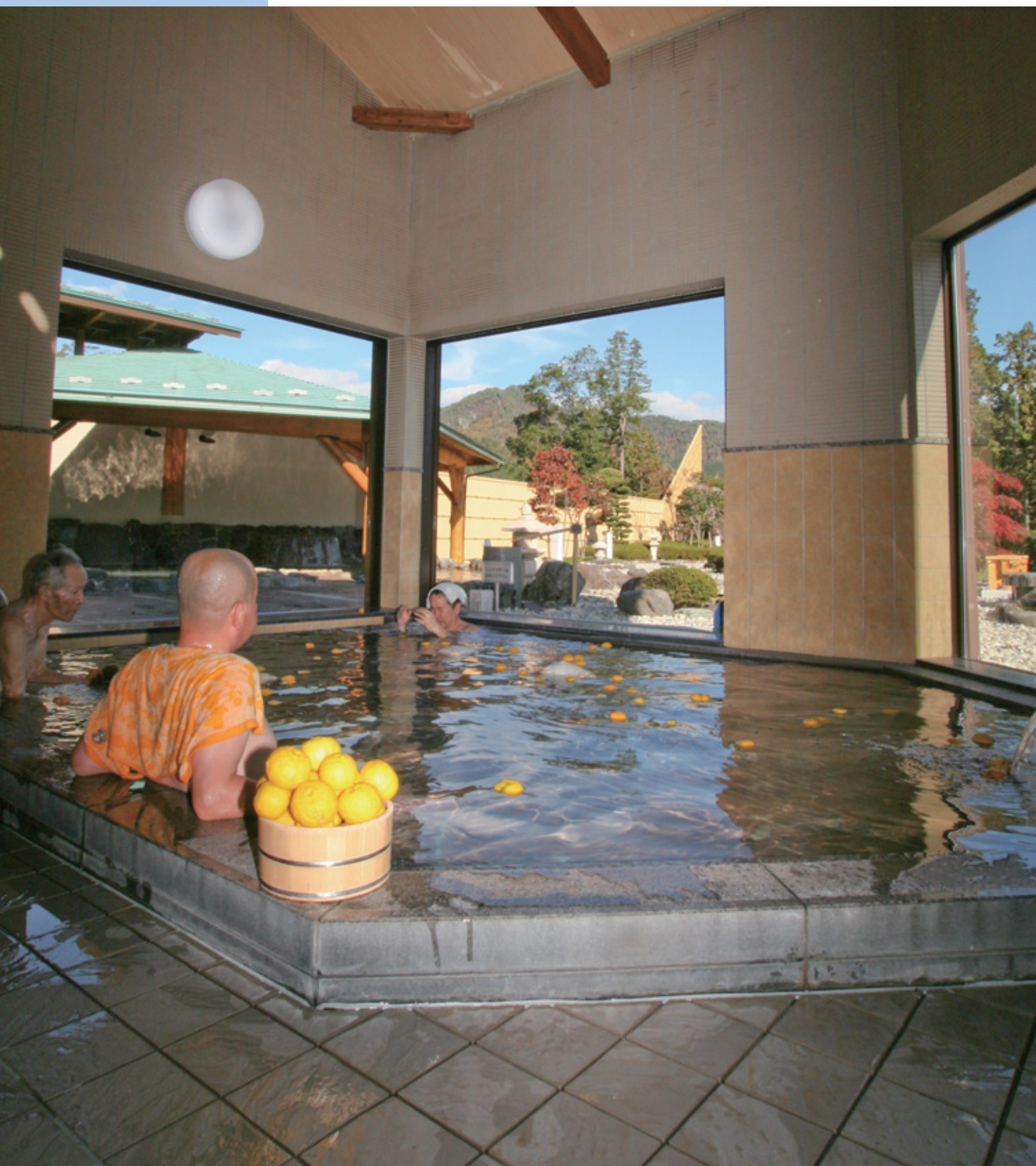
ゆず風呂 始まる（上之保温泉ほほえみの湯）