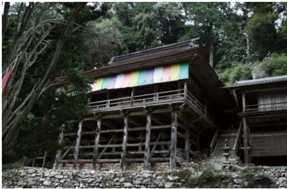
高澤観音（日龍峰寺 下之保多良木）

市民の皆さんからご応募いただいた中から平成20年2月に選定した「私の好きな関の風景」をご紹介します。