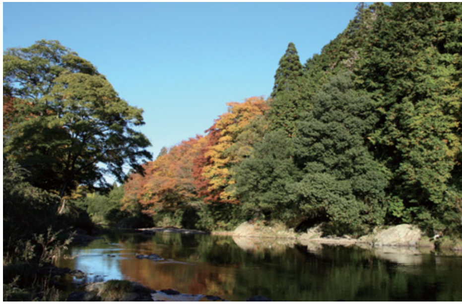
せいべい おおもん 淵（下之保大門）