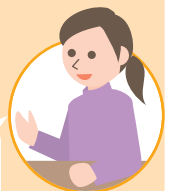
学習アドバイザー

大きな意味での『学び』の場。コミュニケーションをとりながら、子どもが心を開いてくれればいいですね