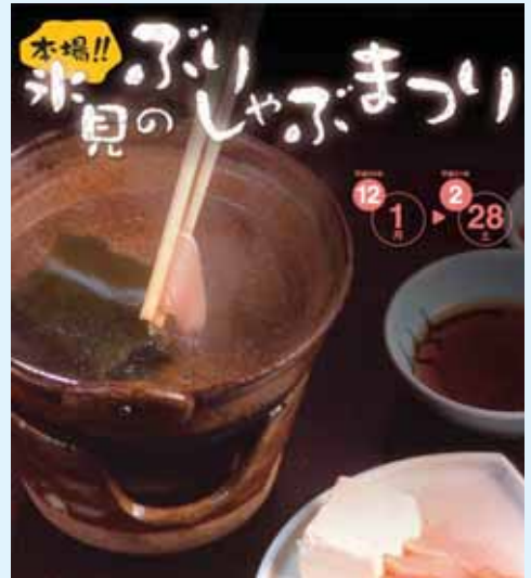
▲本場!! 氷見のぶりしゃぶまつり