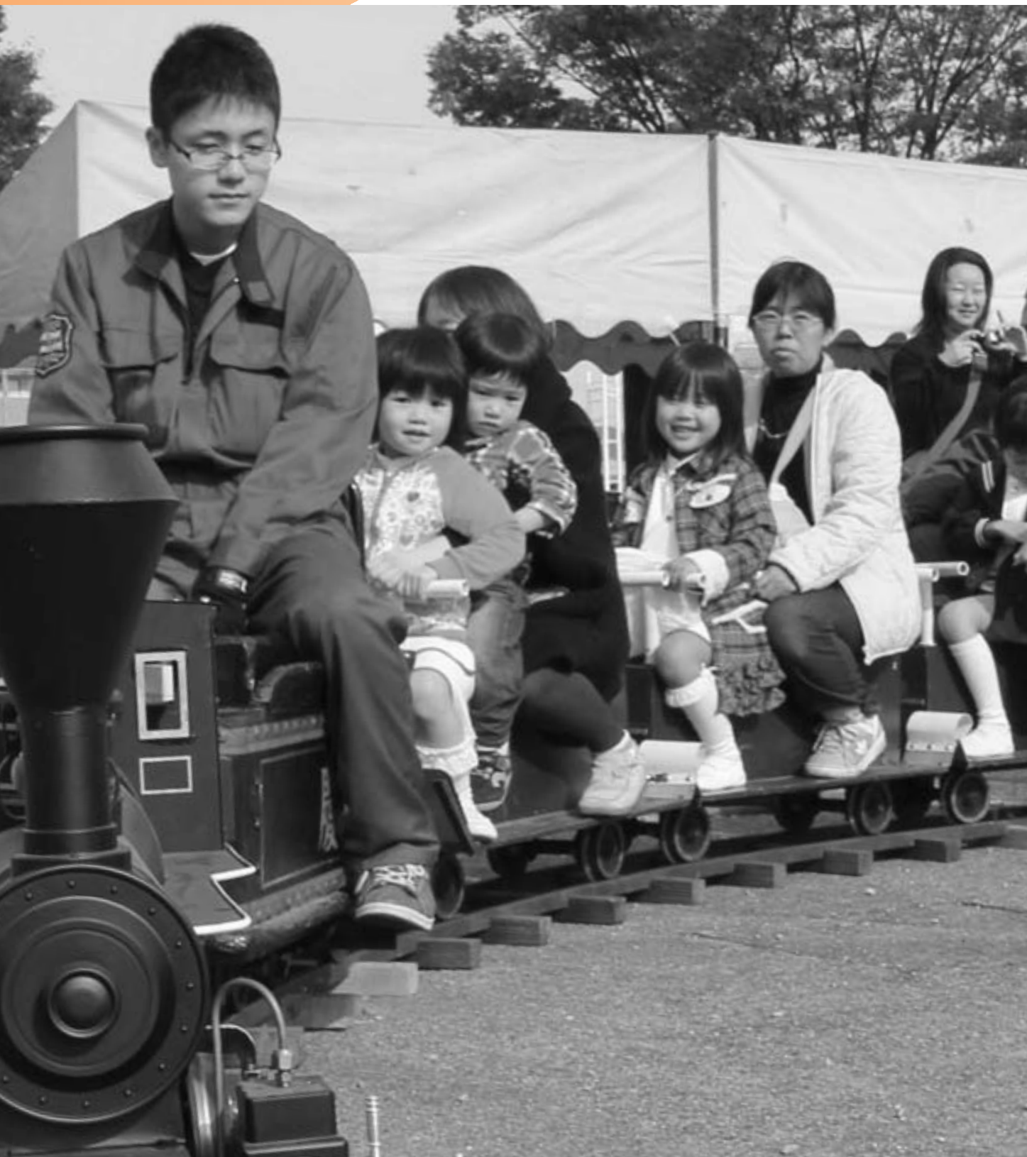
ミニSLに乗ったよ(公共交通フェスティバル・関市文化会館)