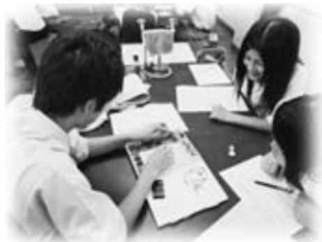
桜ヶ丘中学校（3年生）での出前授業の様子（平成23年9月30日）

中学生と高校生と一緒に練習をしたり、関商工高校の顧問による技術指導を行います。また、東海大会や全国大会で入賞した部活動や専門教育の成果を、中学生に見てもらいます。