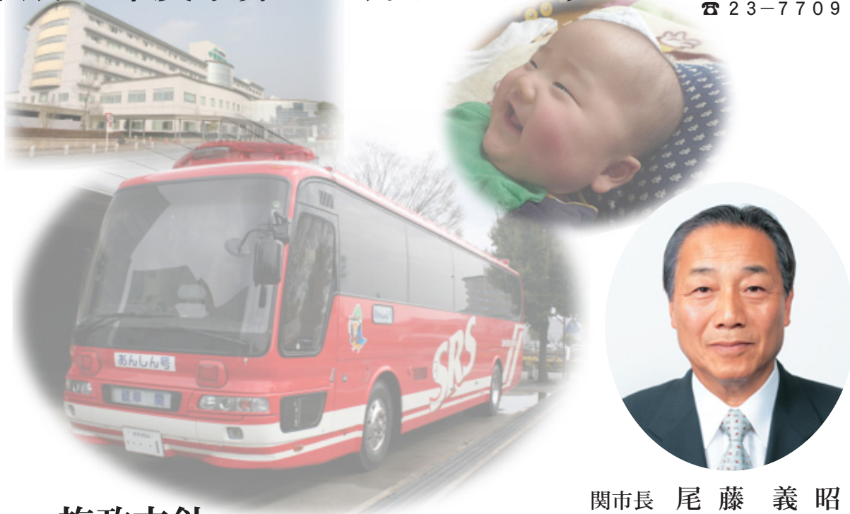
関市長 尾藤 義昭