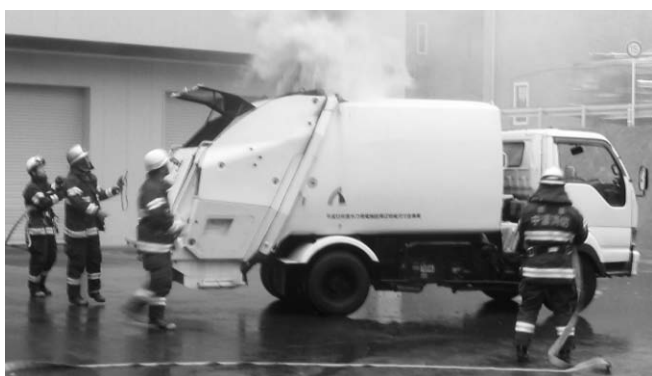
▶ 激しく燃えるパッカー車