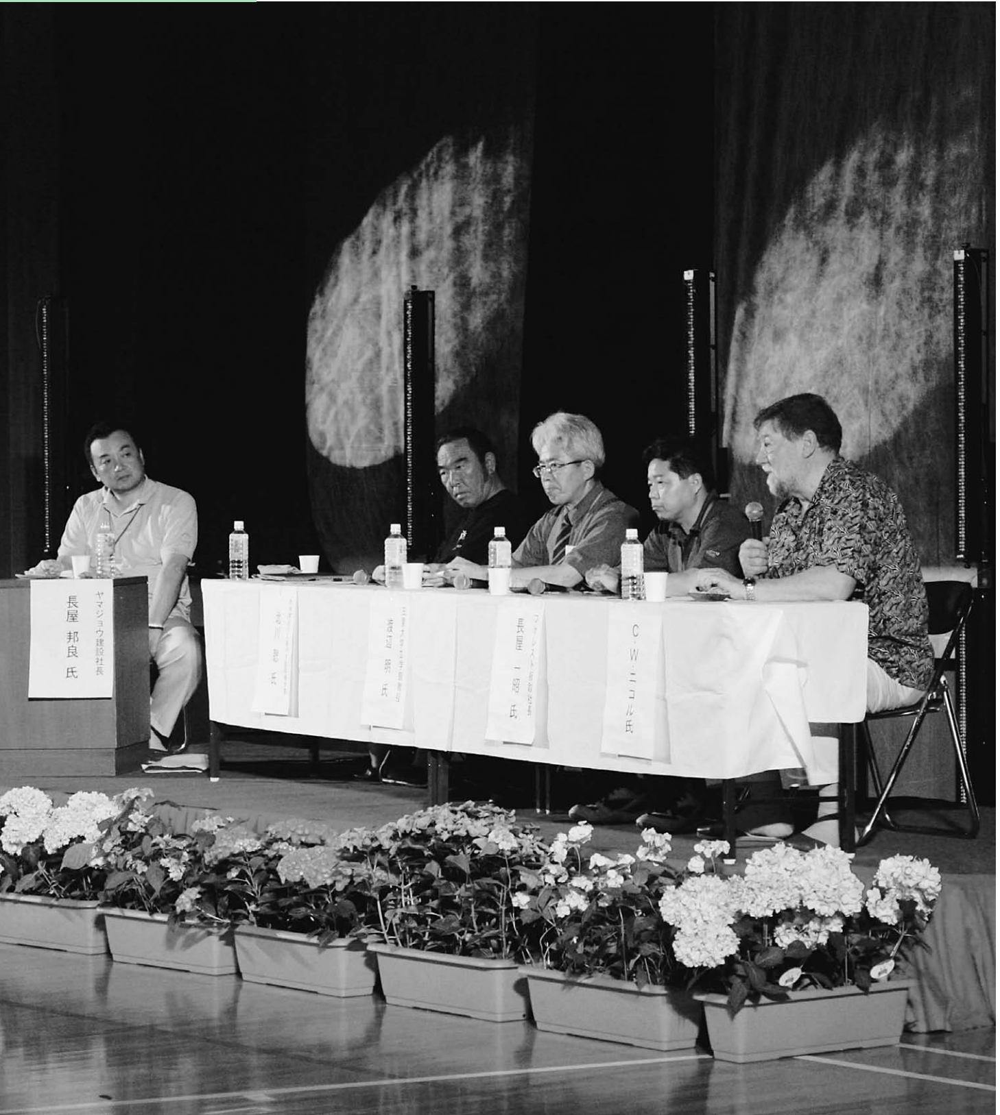
板取あじさい村フェスティバル(板取 21 世紀の森公園ほか)