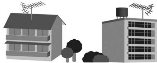
共同受信施設のアパート・マンション

施設の地上デジタル化対応において、経費負担が過重となる場合（世帯当たり 35,000 円以上）、国の助成が受けられます。ただし、国・地方公共団体などが所有する共同受信施設は助成対象とはなりません。