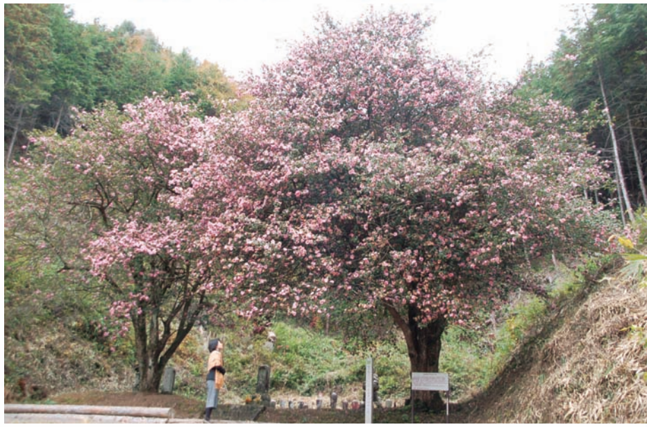
正武寺のさざんか（志津野）

市指定天然記念物。2本あり、樹齢が250年を超え、高さが約10メートルあります。