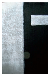
図版掲載 『夜雪』2001年 和紙、墨、銀泥、胡粉

もに歩んできた桃紅にとって、白と黒という色はあらゆるものを見い出すことができる特別な色です。