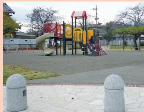
▲地域との連携によって整備された共栄公園