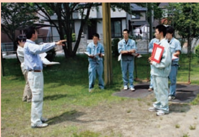
▲公園を調査する高校生

市民記者会議では、「関市がこうなったら もっと楽しい！」という妄想が広がりました。今回、そんな妄想を大まじめに掘り下げようと、この「市民勝手に討論会」を開催します。 市民記者の私たちが、「市長」になった気で、勝手にマニフエスト（公約）を作り、それを勝手に討論してしまうのです。可決された場合は、実際に市長へ提案します。 もちろん、私たちの妄想ですので、関市が本当に実施するわけではないですからね・・・。