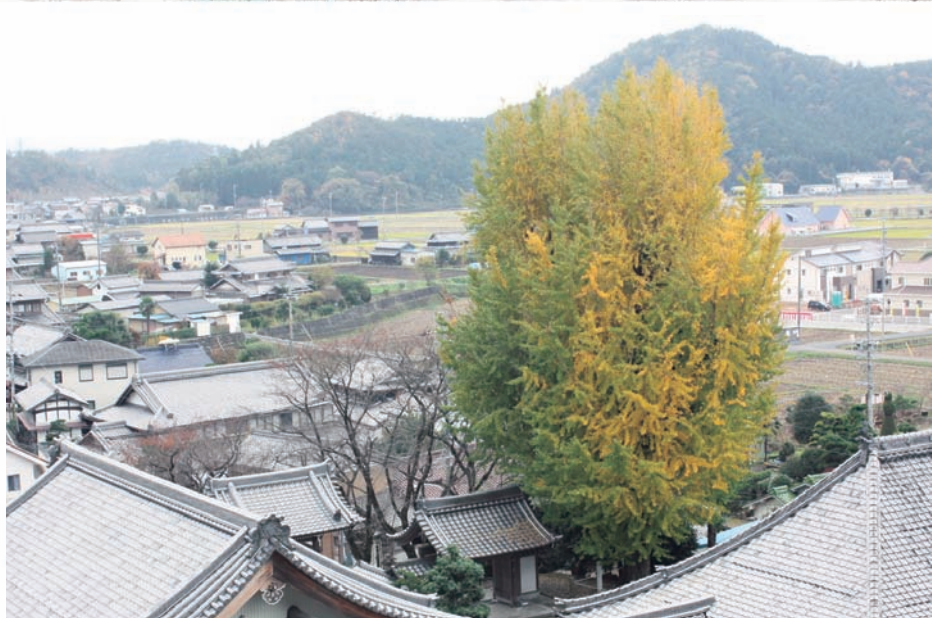
永昌寺のイチョウ（小瀬）

市民の皆さんからご応募いただいた中から平成20年3月に選定した「私の好きな関の風景」をご紹介します。