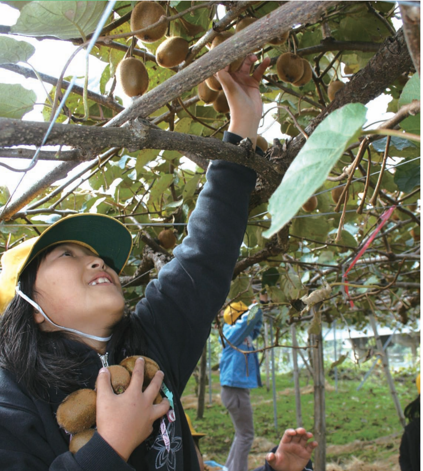
洞戸小学校 3年生・キウイの収穫体験(洞戸市場)