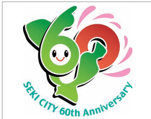
【市制60周年記念ロゴマーク】 最優秀作品 田中一則（62歳） 鹿児島県鹿児島市 佳作 高瀬清二（57歳） 岐阜県山県市