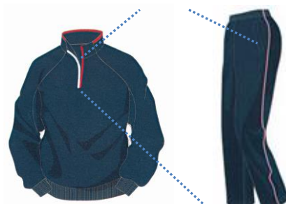
ジャージのイメージ ハーフジップタイプ