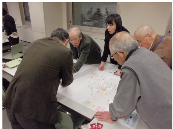
グループワークのようす