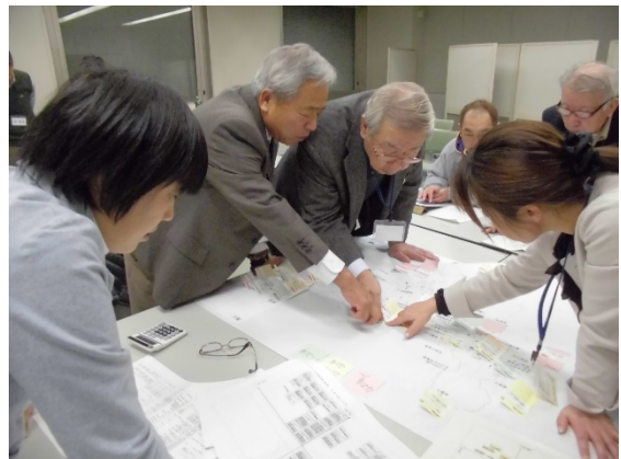
グループワークのようす