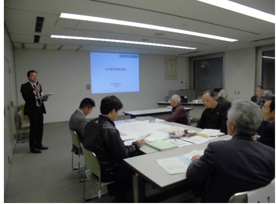
事務局からのあいさつ