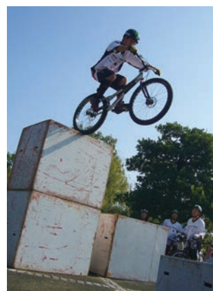
バイクトライアルデモンストレーション

【体験】 ●ソーラーカーなどエコ工作、エコランカー乗車（未就学児）、手回し発電機、丸太切り、竹細工