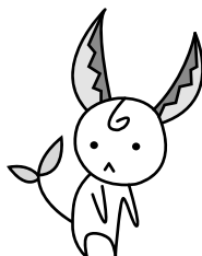
イメージキャラクター 関*はもみん

市の伝統的産業である刃物で未来を切 り開き、新芽は市がより大きく育つようにとの 願いが込められています。