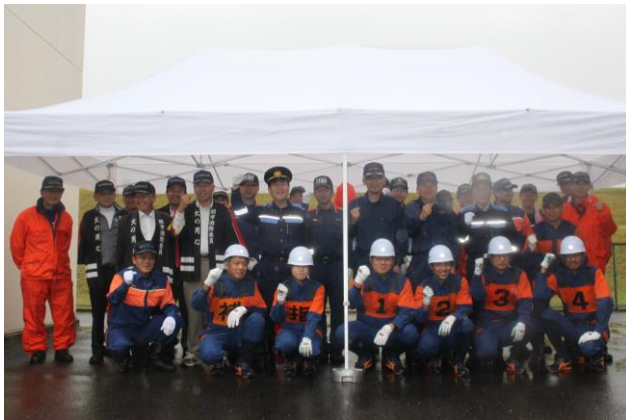
県操法大会(選抜チーム出場)①