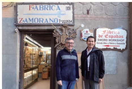
刀剣工房兼店舗の前でオーナーと

切るというよりは強く叩いて騎乗している相手を落とす目的で作られており、日本刀よりかなり重さがありますし、固い甲冑を叩いても折れないように柔軟性があります。