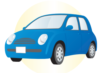
タイヤロックなど

※金額の大きさを問わず、滞納処分を行います。その際に本人の承諾を得ることはありません。