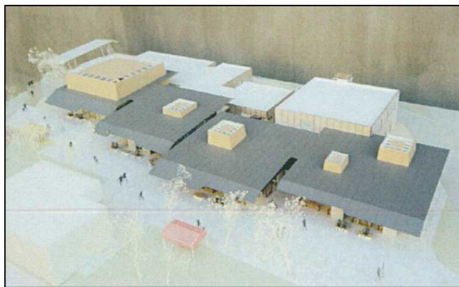
拠点施設のイメージ (※設計前段階でのイメージのため、完成は異なる場合があります。)