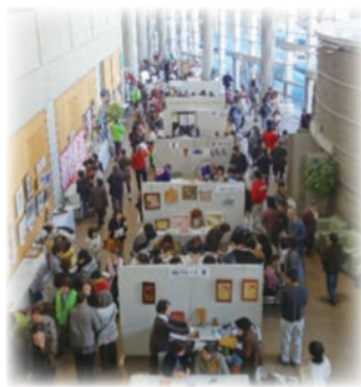
〈学習情報館内の体験コーナー〉