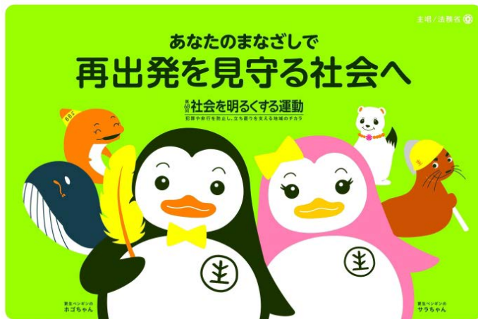
7月は「社会を明るくする運動」強調月間・再犯防止啓発月間です。