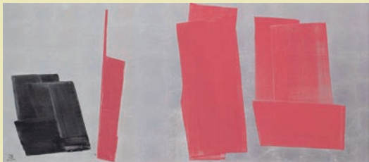
作家名: 篠田桃紅 素材: 墨、朱、プラチナ地、和紙 作品名: 表情 サイズ: 65.0×151.0 (cm) 制作年: 2002年