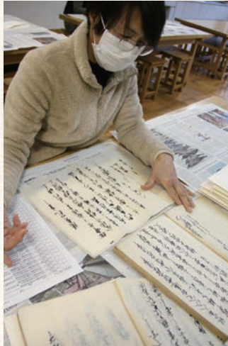
もんじよせいり 文書整理

貴重書庫にある史料を「ただ保存するだけでなく、この宝を後世に残していきたい」と古文書に興味・関心を持つ市民の皆さんが整理のお手伝いをしています。