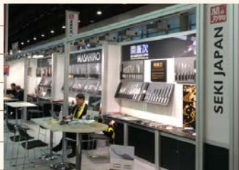
「関の刃物」出展ブースの様子 (国際見本市「アンビエンテ2019」)

次に訪れたチェコ・プラハでは、関の刃物も取り扱っていただいている刃物販売会社を訪問。