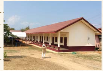
新たに建設され、寄贈された寄宿舎 (ラオス・カムクート郡)

今回の海外視察に際しご支援ご協力をいただいた関係者の皆様、関ライオンズクラブの皆様へ感謝申し上げます。