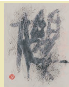
【作品介绍】 作家名: 篠田桃紅 作品名: 櫻 制作年: 1993年 素材: 墨、和紙 サイズ: 47.0 × 38.0 (cm)

会期 4月5日(金) — 6月20日(木) 会場 関市役所・北庁舎7階(☎23-7756) 開館時間 午前9時～午後4時30分 休館日 月曜日(ただし、4月29日、5月6日は開館)、5月7日(火)