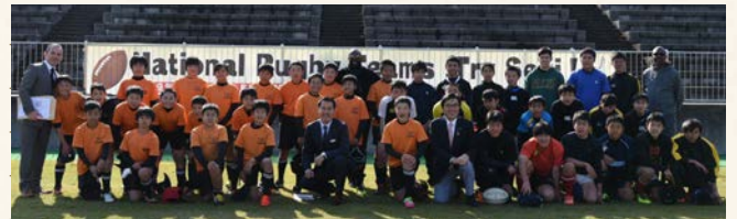
駐日南アフリカ共和国大使と市内ラグビーチームの子どもたち

関市としては、合宿を受け入れる条件として、①子ども達との交流、②市民対象の公開練習、③日本刀鍛錬や鵜飼の鑑賞など、何点か協会を通じて南アフリカに求めています。