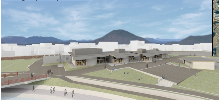
「刃物ミュージアム回廊」の地域交流施設(左)と岐阜県刃物会館(右)

地域交流施設は、刃物ミュージアム回廊エリア内にある左図の施設です。 地域交流施設には、観光案内所・刃物工房(刃物関連の体験スペース)・キッチン設備も使える多目的ホールなどの諸室が入ります。