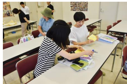
ものづくりを体験できるワークショップ