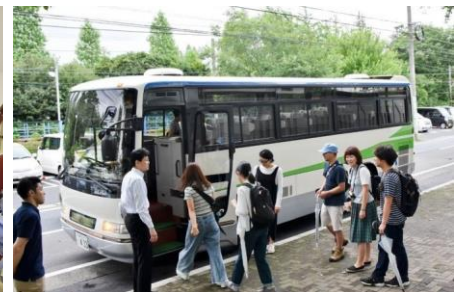
工場を巡るツアーバス