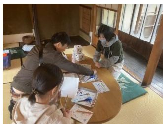
関のはさみはどっち?