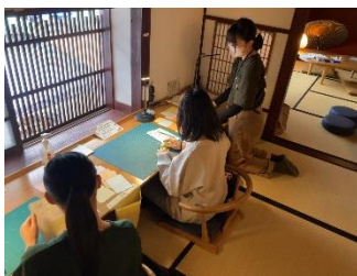
ラインカッターで切り絵!