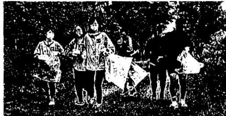
ジョギングをしながらごみを拾う 参加者=関市若草通

関市役所周辺でプロギングに汗 シーシーアイと市職員 自動車用ケミカル製品を手がけるシーシーアイ(関市新迫間)と市の職員計9人が、市役所周辺でジョギングしながらごみを拾う「プロギング」に汗を流した。