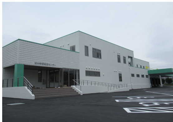
関市学校給食センター